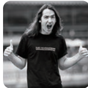
写真家 イルコ・アレクサンドロフ